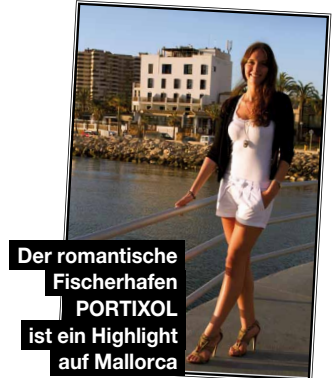
Der romantische Fischerhafen PORTIXOL ist ein Highlight auf Mallorca

Neugierig geworden? Jetzt Mallorca entdecken. Mit Lufthansa 2x täglich nonstop ab Düsseldorf. Informationen und Buchung auf lufthansa.com .