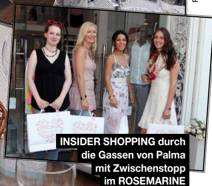
INSIDER SHOPPING durch die Gassen von Palma mit Zwischenstopp im ROSEMARINE