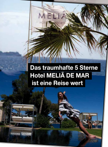
Das traumhafte 5 Sterne Hotel MELIÁ DE MAR ist eine Reise wert

Lufthansa, Sunshine Live und SMAG schickten vom 09.-12.05. vier Destination-Scouts auf die faszinierende Baleareninsel Mallorca. An vier Tagen galt es ein atemberaubendes Insider-Programm durch die elegante Hauptstadt der Balearen und das malerische Umland zu entdecken.